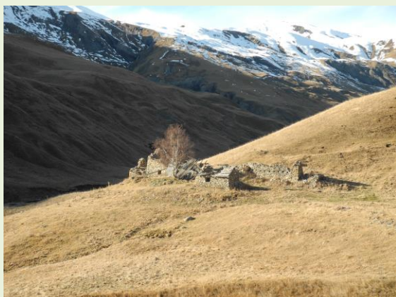
Etat des lieux